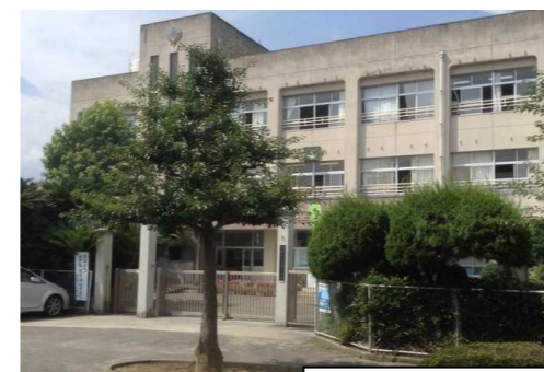
丹原小学校 徒歩3分