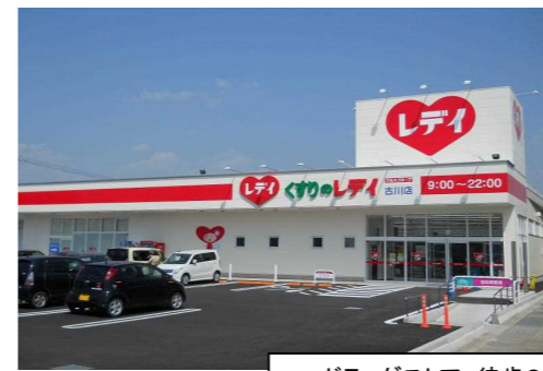
ドラッグストア 徒歩3分