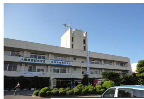
西条市丹原総合支所 徒歩5分