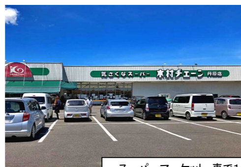
スーパーマーケット 車で1分